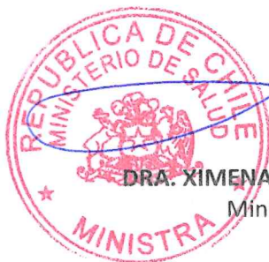
DRA. XIMENA AGUILERA SANHUEZA Ministra de Salud

Para materializar dicho compromiso en acciones concretas, se elaboró el presente plan con el trabajo de los equipos del MINSAL, Superintendencia de Salud, Instituto de Salud Pública de Chile, Fundación para la Seguridad del Paciente, Sociedad Chilena de Calidad Asistencial (SOCCAS) y Fundación Me Muevo. Agradecemos la participación y colaboración de quienes han creído en este proyecto y han aportado con sus ideas, creatividad y entusiasmo a la elaboración del documento. Así como también, a todas las personas y organizaciones que ejecutarán las medidas para prevenir, mitigar y controlar el daño a los pacientes y sus familias durante su atención de salud.